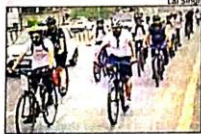
Over 300 cyclists participated in the cyclathon in Guwahati on Tuesday