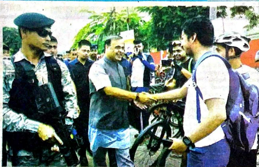
বিশ্ব ধপাতবিবোধী দিবস উপলক্ষে উলিওরা চাইকেন বেলীত অংশগ্রহণ করা যুবকসকলক মুখ্যমন্ত্রী'র অভিষেক, গুৱাহাটী