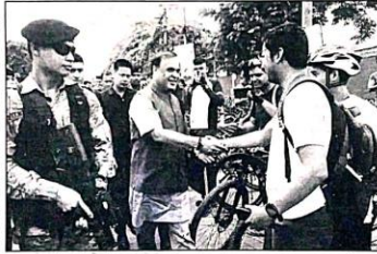
मुख्यमंत्री ने युवाओं से बातचीत की।

मुख्यमंत्री ने कहा कि तंबाकू नशे से जीवन बचाने का एकमात्र तरीका है कि युवा तंबाकू से दूर रहें। उन्होंने कहा कि तंबाकू नशा जीवन को नष्ट कर देता है और इसे छोड़ना ही जीवन बचाने का एकमात्र तरीका है।