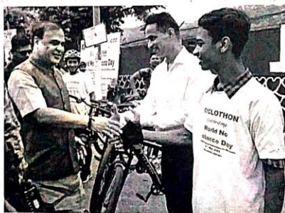
Chief Minister Himanta Biswa Sarma interacting with the participants of the cyclothon, in Guwahati on Tuesday.