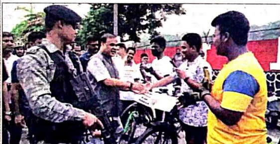
विश्व तंबाकू निषेध दिवस पर साइक्लोथॉन में भाग लेने वाले युवाओं के साथ बातचीत करते मुख्यमंत्री

पूर्वांचल प्रहरी कार्यालय संबाददाता गुवाहाटी: विश्व तंबाकू निषेध दिवस के अवसर पर केंज्यूर लीगल प्रोटेक्शन फोरम के तत्वावधान में उपभोक्ता आवाज, नई दिल्ली और असम गुवाहाटी साइक्लिंग एसोसिएशन के सहयोग से लोगों के जीवन बचाने के लिए तंबाकू निषेध कानूनों को मजबूत करने की मांग के साथ ही